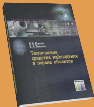
Технические средства наблюдения в охране объектов