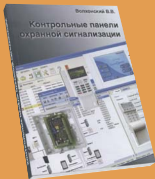
Контрольные панели охранной сигнализации