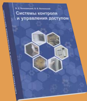
Системы контроля и управления доступом