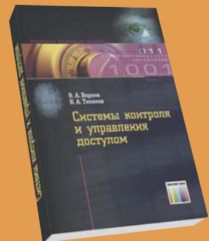
Системы контроля и управления доступом