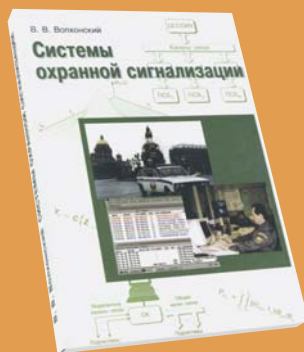
Системы охранной сигнализации