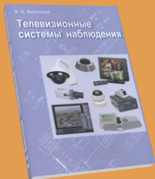
Телевизионные системы наблюдения